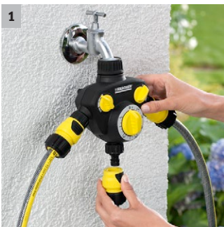
1 2 unabhängige, regulierbare Wasseranschlüsse und 1 Abgang mit Bewässerungsuhr

3-Wege-Verteiler inkl. Bewässerungsuhr. Die Bewässerung stoppt automatisch nach Ablauf der gewählten Zeit (max. 120 Minuten). Mit G1-Hahnanschluss und G3/4-Reduzierstück.