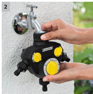
2 Leichtgängige Überwurfmutter