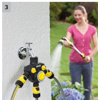
3 Gewinde aus Kunststoff