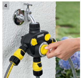
4 Hahnanschluss und Vorfilter inklusive